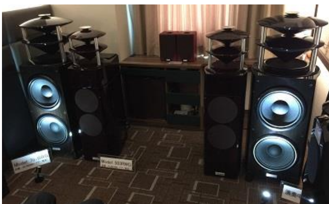
<メルコシンクレッツ>