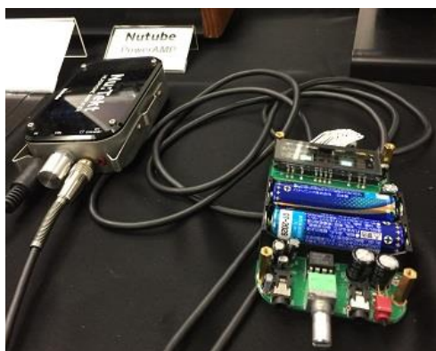
ヘッドフォンアンプ

新世代真空管 Nutube (ニューチューブ) を搭載している製品の展示がありました。二本真空管は、ノリタケ伊勢電子と KORG が共同開発した真空管で、アノード・グリッド・ファラメントの三極管構造により、真空管サウンドを表現するとのことです。興味があった、Nutube 搭載 DAC 「Nu 1」は、PC の調整中とのことで音が聴けませんでした。