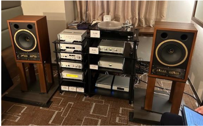
オーディオテクニカ