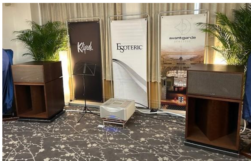
オーロラサウンド