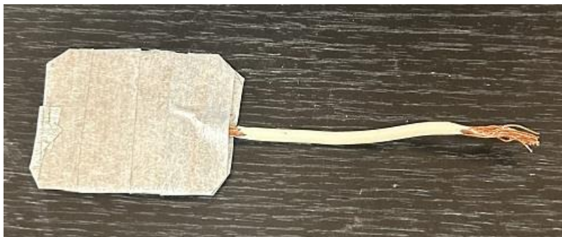
銅板に Pulshut を貼ったもの(仮想アース A)

レコードアンチスタティックの仮想アースへの応用については、次のようなものを準備しました。