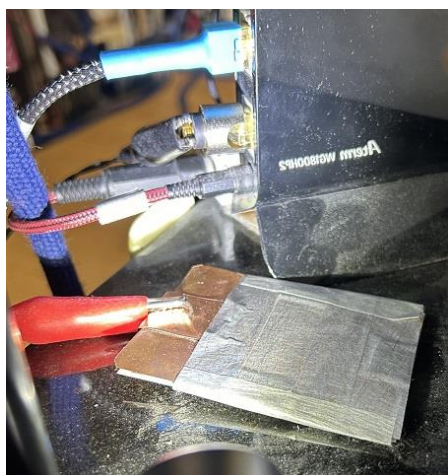
ルーターの LAN ポート