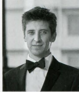
ヴィオラ アントン・ジヴァエフ Anton Jivaev

1958年ライプツィヒ生まれ。1971年～1981年、ベルリン(ハンス・アイスラー)とライプツィヒ(フェリックス・メンデルスゾーン・バルトルディ)の音楽大学のマスタークラスでヴァイオリンと室内楽を学ぶ。1981年にライプツィヒのゲヴァントハウス管弦楽団に入団し、1984年に同楽団の首席コンサートマスター代理に任命された。同楽団における活動の他に、ドイツのさまざまなピアニストとのデュオ演奏会を定期的に行っている。1989年にゲヴァントハウス弦楽四重奏団に加わり、また、1993年にはパイロイト祝祭管弦楽団のメンバーとしても活躍している。